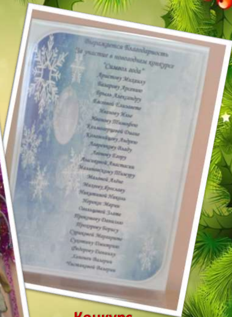
Конкурс “Символ Нового года”