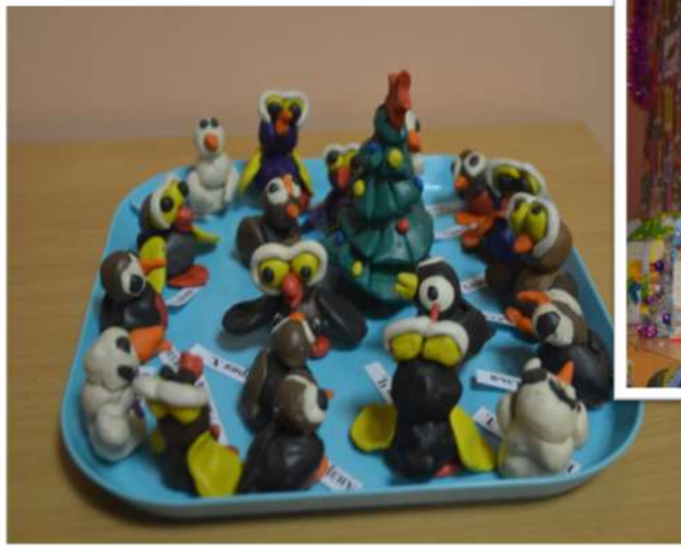
Лепка "У новогодней ёлки"