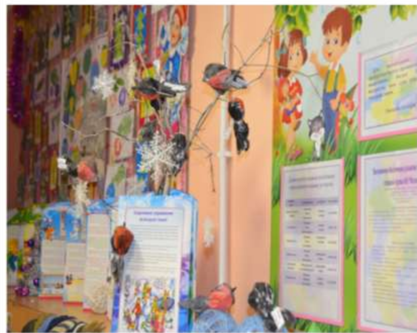
Работа в смешанной технике "Снегири"